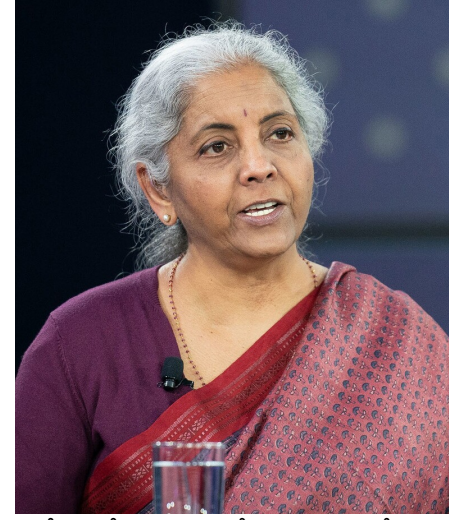
ఆలోచన లేదని స్పష్టం చేశారు. 2024 లోక్ సభ ఎన్నికల సమయంలో దాదాపు లక్ష కోట్ల రూపాయలు ఖర్చు చేశారని, జమిలి ఎన్నికలు నిర్వహిస్తే ఈ మొత్తం ఆదా అవుతుందని నిర్మలా సీతారామన్ తెలిపారు. మిగతాది 2లో...

న్యూఢిల్లీ, ఏప్రిల్ 5(జర్నలిస్ట్ వార్త): పార్లమెంటు, రాష్ట్రాల అసెంబ్లీలకు ఒకేసారి ఎన్నికలు నిర్వహిస్తే దేశ జిడిపీలో 1.5 శాతం వృద్ధి కనిపిస్తుందని కేంద్ర ఆర్థిక మంత్రి నిర్మలా సీతారామన్ పేర్కొన్నారు. వచ్చే లోక్ సభ ఎన్నికల నాటికి జమిలి ఎన్నికలు ఉంటాయన్న ప్రచారంపై ఆమె స్పందించారు. చెన్నైలో ఏర్పాటు చేసిన కార్యక్రమంలో ఆమె మాట్లాడుతూ, వచ్చే లోక్ సభ ఎన్నికల నాటికి జమిలి ఎన్నికలు నిర్వహించే