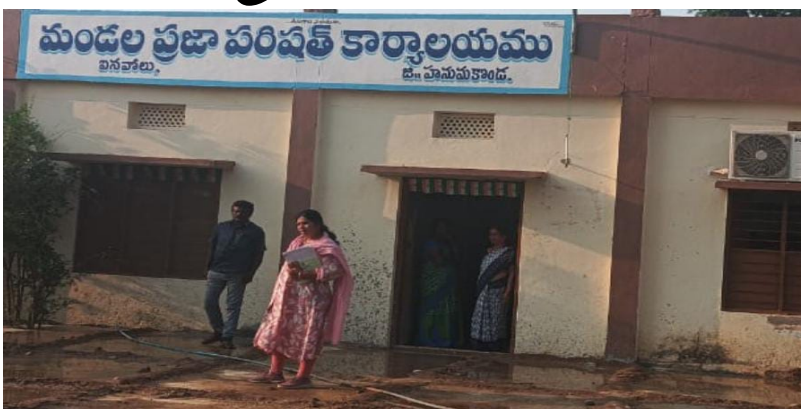
ఐనవోలు మండల పరిషత్ కార్యాలయం