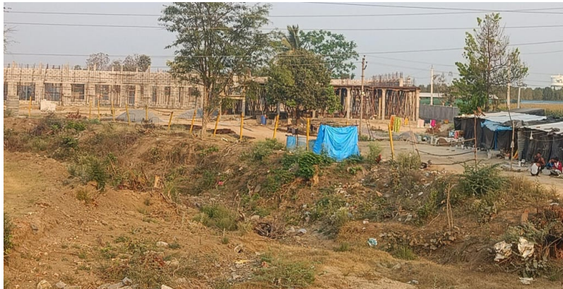
పూర్తి కావచ్చిన అనుమతులు లేని నిర్మాణం