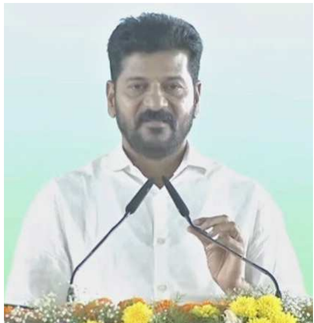
ఎన్ డీఆర్ ఎఫ్ తరహాలో సుశిక్షితమైన దళం అవసరమని భావించి ఈ నిర్ణయం తీసుకున్నారు. ఈ క్రమంలో ఎన్ డీఆర్ ఎఫ్ ను ఏర్పాటు చేయడంతో పాటు దీనిని ఆధునికీకరించేందుకు రాష్ట్ర ప్రభుత్వం రూ.35.03 కోట్లు మంజూరు చేసింది. ఈ నిధులతో ఆధునాతన పరికరాలు, కొత్త అగ్నిమాపక వాహనాలను కొనుగోలు చేసి సిబ్బందికి ఎన్ డీఆర్ ఎఫ్ ప్రాథమిక కోర్సులో శిక్షణ ఇప్పించారు.