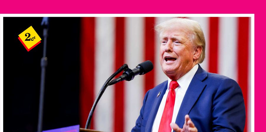
- డాలర్ స్థానంలో వేరే కరెన్సీని ఉపయోగించే దేశాలపై పన్నులు - డొనాల్డ్ ట్రంప్ కీలక ప్రకటన