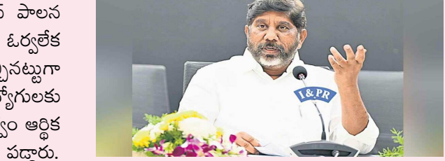
నిర్ణయాల వల్ల ఆర్థిక ఇబ్బందులు పడుతున్నాం అని తీవ్రంగా మండిపడ్డారు. ఒక్క యాదాద్రి భద్రాద్రి పవర్ ప్లాంట్ వద్ద గత ప్రభుత్వం నిర్ణయాల వల్ల ప్రతి ఏటా 170 కోట్లకు పైగా భారం పడిందన్నారు. కొంతమంది స్వార్థం వల్ల విద్యుత్ రంగంలో ఆర్థిక భారం పడుతుందని భట్టి అన్నారు.

సీఎం భట్టి విక్రమార్క రాష్ట్రంలో కాంగ్రెస్ పాలన చాలా అద్భుతంగా కొనసాగుతోందని.. అది ఓర్వలేక బీఆర్ఎస్ ప్రభుత్వం ఇష్టం వచ్చినట్లుగా మాట్లాడుతున్నారని విమర్శించారు. ఉద్యోగులకు జీతాలు ఇచ్చే పరిస్థితి లేకుండా గత ప్రభుత్వం ఆర్థిక వ్యవస్థను చిన్నా భిన్నం చేసిందని మండి పడ్డారు. ప్రజలపై భారం వేయకుండా ఆర్థిక శాఖను ముందుకు కొనసాగిస్తున్నాం అన్నారు. ప్రపంచ వాతావరణం వల్ల గ్రీన్ ఎనర్జీ పై తెలంగాణ ప్రభుత్వం దృష్టి పెట్టిందని.. త్వరలోనే కొత్త విద్యుత్ పాలసీ తీసుకురాబోతున్నాం అని భట్టి విక్రమార్క అన్నారు. గత ప్రభుత్వం విద్యుత్ శాఖలో తీసుకున్న