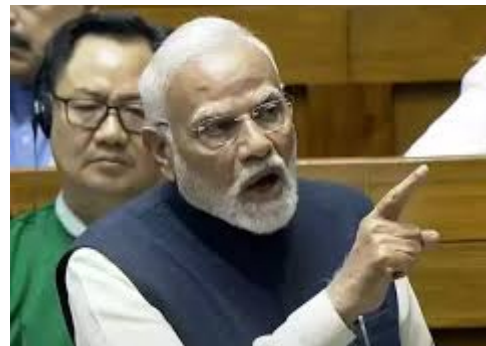
అనేక కుట్రలు చేశారని దుఃఖమెత్తారు. సోనియా గాంధీ కీలక నిర్ణయాలు తీసుకునేవారని మాజీ ప్రధాని మన్మోహన్ అన్నారు. కాంగ్రెస్ పాలనకు ఈ వ్యాఖ్యలే నిదర్శనమన్నారు.

(మొదటి పేజీ తరువాయి) రాజ్యాంక శక్తి, ప్రజల ఆశీర్వాదం తమకు ఉన్నాయన్నారు. తమ పరిపాలనను చూసి ప్రజలు తమకు వరుసగా అవకాశాలు ఇస్తున్నారని తెలిపారు. ఎన్ని కష్టాలు వచ్చినా రాజ్యాంగ పరిరక్షణకు అండగా ఉంటామన్నారు. ఈ దేశాన్ని ఒక కుటుంబం 55 ఏళ్లు పాలించిందని, ఆ కుటుంబమే ఈ దేశానికి ఎన్నో విధాలుగా సష్టం చేసిందన్నారు. రాజ్యాంగ మార్పుపై రాష్ట్రాల సీఎంలకు నెహ్రూ లేఖ రాశారని పేర్కొన్నారు. ఆయన తప్ప చేస్తున్నారని బాబూ రాజేంద్ర ప్రసాద్ చెప్పారని వెల్లడించారు. కాంగ్రెస్ నేతలు రాజ్యాంగానికి 75 సార్లు సవరణలు చేశారని మోదీ అన్నారు. ఎవరైనా విధించి ప్రజల హక్కులను కాలరాశారని ఆవేదన వ్యక్తం చేశారు. వేలాది మందిని జైళ్లకు పంపించారని, కోర్టుల నోరు, పత్రికల గొంతు నొక్కేశారన్నారు. సుప్రీంకోర్టు న్యాయమూర్తుల పదోన్నతిని కూడా అడ్డుకున్నారని విమర్శించారు. ఓటు బ్యాంకు రాజకీయాల కోసం