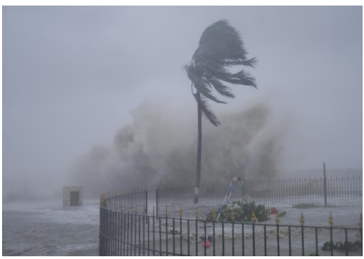
ఆగ్నేయ బంగాళాఖాతంలో అల్పసీదనం ఏపీ, తెలంగాణలోకి కొన్ని ప్రాంతాల్లోవర్షాలు