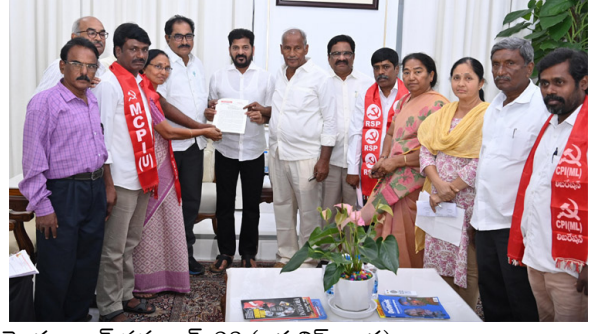
హైదరాబాద్,నవంబర్ 23,(జర్నలిస్ట్ వార్త): కొడంగల్లో ఏర్పాటు చేసేది ఫార్మా సీటీ కాదని, ఇండస్ట్రియల్ కారిడార్ ను ఏర్పాటు చేస్తున్నట్లు సిఎం రేవంత్ రెడ్డి పేర్కొన్నారు. నియోజకవర్గంలో యువత,మహిళలకు ఉపాధి కల్పించడమే తన ఉద్దేశమని ఆయన స్పష్టం చేశారు. సిఎం రేవంత్ రెడ్డిని సచివాలయంలో వామపక్ష పార్టీల ప్రతినిధుల బృందం శనివారం కలిసింది. లగచర్ల ఘటనకు సంబంధించి ఆ ప్రతినిధుల బృందం సిఎంకు వినతిపత్రం అందజేసింది మిగతాది 2లో...

కొడంగల్ యువత, మహిళలకు ఉపాధి కల్పించడమే లక్ష్యం నియోజకవర్గంలో కాలుష్యరహిత పరిశ్రమలే ఏర్పాటు చేస్తాం నా సొంత నియోజకవర్గ ప్రజలను ఎందుకు ఇబ్బంది పెడతా లగచర్ల కుట్రదారులను విడిచిపెట్టం పరిహారం పెంపును పరిశీలిస్తాం లచర్ల ఘటనపై ముఖ్యమంత్రికి వినతిపత్రం అందజేసిన లెఫ్ట్ నేతలు