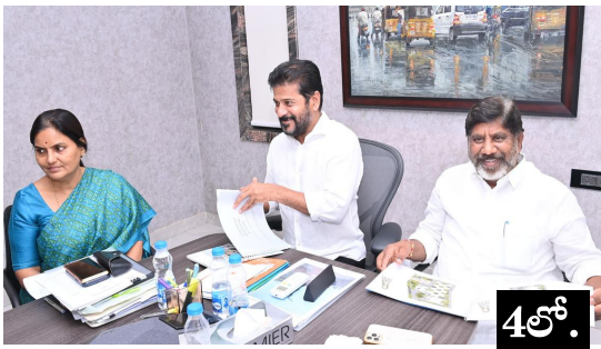
సమీకృత గురుకుల భవనాలకు నేడు శంకుస్థాపన