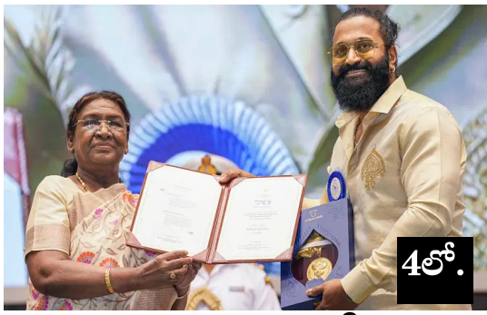
అట్టహాసంగా జాతీయ చలన చిత్ర అవార్డులు