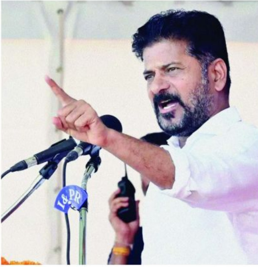
తీవ్రంగా హెచ్చరించారు. బావ, బావమ్మల అక్రమాల బయటకు తీస్తాం బీఆర్ఎస్ నేతలపై తీవ్రస్థాయిలో విరుచుకుపడ్డారు సీఎం రేవంత్ రెడ్డి. మూసీ అభివృద్ధిని అడ్డుకుంటున్న కారు పార్టీ నేతల బాగోతాలను బయటపెట్టారు. జనాభా, అజీజ్ నగర్ ఫామ్ హౌస్ లు అక్రమ నిర్మాణాలు కాదా అంటూ ప్రశ్నించారు. సబితా ఇంద్రారెడ్డి ఆస్తుల గురించి అందరికీ తెలుసని, ఎంపీ ఈటెల రాజేందర్ కు పాత్ర వాసన తీలేదన్నారు. మూసీ ప్రక్షాళనను బీఆర్ఎస్ నేతలు అడ్డుకోవడాన్ని తూర్పారబట్టారు సీఎం రేవంత్ రెడ్డి. మూసీ అభివృద్ధి విషయంలో అవసరమైతే అఖిలపక్షం ఏర్పాటు చేస్తామని మిరచి రావాలని అన్నారు. చెరువు భూములను ఫ్యాట్లు చేసి అమ్ముకున్నది బీఆర్ఎస్ పార్టీ కాదా అంటూ ప్రశ్నించారు. అక్రమణలు తొలగిస్తే సంచలు ఎలా వస్తాయని, తీసుకున్నవారికే వాటి గురించి తెలియాలని కేటీఆర్ కు చరతులు అందించారు. సికింద్రాబాద్ సిటీ విలేజ్ ప్రాంతంలోని హాకీ మైదానంలో కుటుంబ గుర్తింపు, డిజిటల్ కార్డు లైట్ ప్రాజెక్ట్ ప్రారంభోత్సవ కార్యక్రమం జరిగింది. దీనికి ముఖ్యమంత్రి రేవంత్ రెడ్డి హాజరయ్యారు. ఈ సందర్భంగా మాట్లాడిన సీఎం, పేదలకు అన్యాయం జరిగిందంటూ బీఆర్ఎస్ నేతలు ఏడుస్తున్నారని అన్నారు. రాష్ట్రాన్ని దోచుకున్న నిధులు బీఆర్ఎస్ ఖాతాలో రూ.1500 కోట్లు ఉన్నాయని, అందులో రూ.500 కోట్లు మూసీలో ముంపునకు గురైనవారికి పంచిపెట్టాలన్నారు. హైద్రాబాద్ అసెంబ్లీలో చర్చ జరిగినప్పుడు ఆరోజు సూచనలు ఎందుకు చేయలేదని సూటిగా ప్రశ్నించారు. కేటీఆర్, హరిశ్ చావు, సబిత కుమారుల ఫామ్ హౌస్ లు కూర్చోలా వద్దా? మిరచి చెప్పాలంటూ ప్రజలను ప్రశ్నించారు. మూసీ నదీని అడ్డుపెట్టుకుని ఫామ్ హౌస్ లు కాపాడుకోవాలని బీఆర్ఎస్ నేతలు ప్రయత్నిస్తున్నారని మండిపడ్డారు ముఖ్యమంత్రి. హైదరాబాద్ ను ఎలా కాపాడుకోవాలి అంటే అలాంటివి పనులు చేస్తున్నామా అంటూ అగ్రహం వ్యక్తం చేశారు. ఈ రోజు తీసుకువచ్చా ఏదో ఒకరోజు మిరచి అంటే పదతామన్నారని. మూసీ పేదలకు డబుల్ బెడ్రూంలు ఇవ్వాలా? వద్దా? అనేది ప్రతిపక్షాలు చెప్పాలని బాగామౌనంగా ఉన్నారు. సోషల్ మీడియాలో కిరాణి మనుషులతో బావాబామ్మర్లు హరిశ్ చావు, కేటీఆర్ లు హడావిడి చేస్తున్నారని సీఎం రేవంత్ రెడ్డి మండిపడ్డారు. పదేళ్లు రాష్ట్రానికి దోచుకున్న బీఆర్ఎస్ నేతలు, ఫామ్ హౌస్ లు కాపాడుకోవడానికే హైద్రాబాద్, మూసీ ప్రక్షాళనకు అడ్డుపడుతున్నారని దుయ్యబట్టారు. మూసీ ఒడ్డున జీవచ్ఛవలా బతుకుతున్నవారిని ఆదుకుంటుంటే.. అడ్డుపడతారా? అని దుయ్యబట్టారు.

హైద్రాబాద్ అసెంబ్లీలో చర్చ జరిగినప్పుడు ఏం చేశారు అందుకే ప్రజలు కేసీఆర్ ఉద్యోగం ఉండగొట్టడని ఎద్దేవా చేశారు. తాము అధికారంలోకి వచ్చాక ఉద్యోగ నియామకాలు చేపట్టమని స్పష్టం చేశారు. హైదరాబాద్ నగరాన్ని కాపాడాలన్న ఉద్దేశంతోనే హైద్రాబాద్ మున్సిపల్ కార్పొరేషన్ తీసుకువచ్చామని ముఖ్యమంత్రి రేవంత్ రెడ్డి ఉద్ఘాటించారు. కిరాణి మనుషులతో బీఆర్ఎస్ నేతలు చేసే హడావుడి తెలంగాణ సమాజం గమనిస్తోందని చెప్పారు. పదేళ్లు బీఆర్ఎస్ నేతలు దోచుకున్న సొమ్ము వాళ్ల పార్టీ ఖాతాలో రూ.1500 కోట్లు మూలుగుతున్నాయని. విమర్శించారు. అందులోంచి రూ.500 కోట్లు మూసీ ప్రాంత పేదలకు పంచి పెట్టాలని ముఖ్యమంత్రి రేవంత్ రెడ్డి కోరారు. ప్రత్యామ్నాయం ఏం చేయాలి చెప్పాలని అన్నారు. ప్రభుత్వం వినదానికి సిద్ధంగా ఉందని అన్నారు. హైద్రాబాద్ అసెంబ్లీలో చర్చ జరిగినప్పుడు ఎందుకు మాట్లాడలేదని సీఎం రేవంత్ రెడ్డి ప్రశ్నించారు.