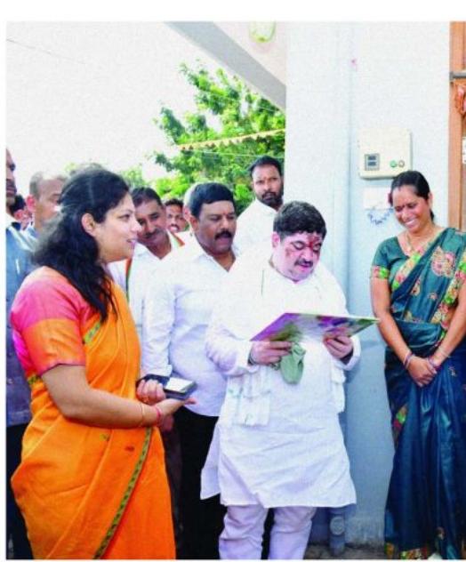
ప్రాంతాల్లో ఇప్పటికే ఈ డిజిటల్ కార్డులను అమలు చేస్తున్నారు.ఇప్పటికే అక్కడ మా అధికారులు అక్కడ పరిశీలించి అధ్యయనం చేశారని తెలిపారు.ప్రతి గ్రామంలో ప్రతి కుటుంబానికి డిజిటల్ కార్డు ఇవ్వాలని ముఖ్యమంత్రి నిర్ణయం తీసుకున్నారని అన్నారు.రాష్ట్ర ప్రభుత్వం రైతులకు రుణమాఫీ చేసింది ఇప్పటికే లక్షా ,లక్షా 50 వేలు ,2 లక్షల

చేశారు.ఈ సందర్భంగా మంత్రి పొన్నం ప్రభాకర్ మాట్లాడుతూ ఈ డిజిటల్ కార్డుల ద్వారానే రేషన్ కార్డు, మోల్ కార్డు , పింఛను , ప్రభుత్వ పథకాలన్నీ ప్రామాణికం కానున్నాయన్నారు. ముఖ్యమంత్రి రేవంత్ రెడ్డి ఫ్యామిలీ డిజిటల్ కార్డు పైలట్ ప్రాజెక్ట్ సికింద్రాబాద్ కంటోన్మెంట్ లో ప్రారంభించారని తెలిపారు.రాష్ట్రం మొత్తం 119 నియోజకవర్గాల్లో 288 చోట్ల ఫ్యామిలీ డిజిటల్ కార్డు పైలట్ ప్రాజెక్ట్ ప్రారంభం అయిందని,ప్రతి నియోజకవర్గంలో ఈ కార్యక్రమం కోసం ఒక గ్రామం , మున్సిపాలిటీ లో ఒక వార్డ్ పైలట్ ప్రాజెక్ట్ గా ఎంపిక చేశారన్నారు. ఎంత మంది పౌరులన్నీ కుటుంబం పరంగా ఫ్యామిలీ డిజిటల్ కార్డు ఇవ్వాలని ప్రభుత్వం సంకల్పం తీసుకుందని తెలిపారు. ఇందులో కుటుంబ ఆస్తుల వివరాలు ఆర్థిక లావాదేవీలు అడగరన్నారు. కుటుంబ సభ్యుల సంఖ్య ఒక గ్రామ పోలో లాంటి వివరాలు మాత్రమే అడుగుతారని తెలిపారు.గత ప్రభుత్వం 10 సంవత్సరాల్లో ఒక్క రేషన్ కార్డు ఇవ్వలేదన్నారు. ఇంట్లో నలుగురు పిల్లలు ఉండి పెళ్ళిళ్ళు అయి వారికి పిల్లలున్న ఫ్యామిలీ డిజిటల్ కార్డు ఇస్తారని,ఈ కార్డు ఉంటే ప్రభుత్వ పథకాలు ఎక్కడైనా తీసుకోవచ్చు అని తెలిపారు. డిజిటల్ గుర్తింపు కార్డు ఫ్యామిలీ వెర్షన్ మామూలు పేరు మీదనే వస్తుందన్నారు. గుర్తింపు కార్డు ద్వారానే ఇందిరమ్మ ఇళ్లు ,పింఛన్లు ప్రభుత్వ పథకాలు అన్ని డిజిటల్