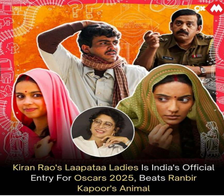
Kiran Rao's Laapataa Ladies Is India's Official Entry For Oscars 2025, Beats Ranbir Kapoor's Animal