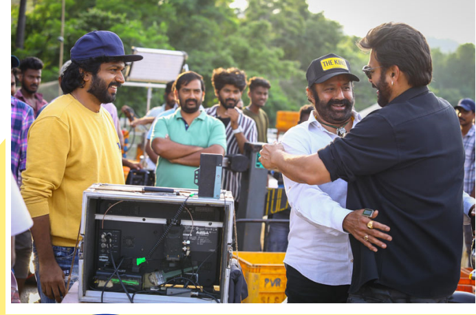
విక్టరీ వెంకటేష్ ప్రస్తుతం చేస్తున్న సినిమా సెట్ లో 'భగవంత్ కేసరి' బాలయ్య సందడి చేశారు. బాలయ్యతో 'భగవంత్ కేసరి' వంటి భాక్ బస్టర్ చిత్రం తర్వాత దర్శకుడు అనిల్ రావిపూడి చేస్తున్న చిత్రం వెంకీఅనిల్ కి. అందుకే 'భగవంత్ కేసరి' సందడి చేశారని పేర్కొనడం జరిగింది. విక్టరీ వెంకటేష్, భాక్ బస్టర్ మెషిన్ అనిల్ రావిపూడి, శ్రీ వెంకటేశ్వర క్రియేషన్స్ ల కాంబినేషన్ లో రావుదిద్దుకుంటోన్న శ్రేణి ఎంటర్టైన్ మెంట్ కి అనిల్ కి.