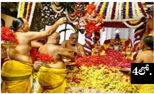
శ్రీవారి ఆలయంలో మహా శాంతి యాగం