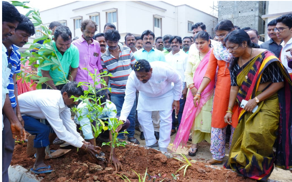
చేస్తుంటుంటే ఎనిమిది నూతన కళాశాలలు, ఇందిరా మహిళా శక్తి కాంటీన్ పరిశీలించారు. ఈ సందర్భంగా కళాశాల ప్రాంగణంలో కలెక్టర్, ఎమ్మెల్యేలు మొక్కలు నాటారు.