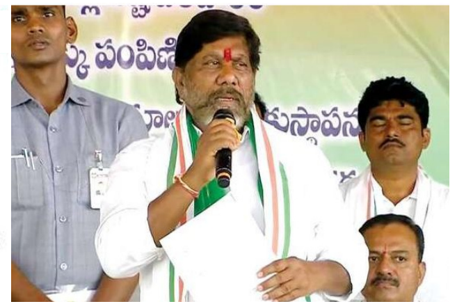
పెద్దపల్లి, సెప్టెంబర్ 14,(జర్నలిస్ట్ వార్త): రాజ్ యే ఐదేళ్లలో మహిళా సంఘాలకు లక్ష కోట్ల రూపాయల వడ్డీరేని రుణాలను అందిస్తామని తెలంగాణ రాష్ట్ర ఉప ముఖ్యమంత్రి మల్లు భట్టి విక్రమార్క తెలియజేశారు. శనివారం పెద్దపల్లి జిల్లా కేంద్రంలో ఏర్పాటు చేసిన ప్రగతి సభలో మాట్లాడుతూ