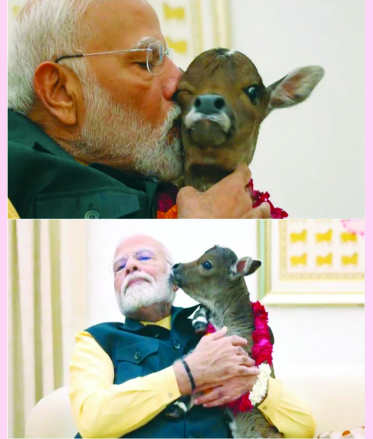
పెట్టినట్లు మోదీ సందేశం వెలువరించారు. పుట్టిన దూడ ఓ బిడ్డగా ఇంటిలోపలికి రావడం, కలియతిరగడం, మోదీ ఈ దూడను

న్యూఢిల్లీ సెప్టెంబర్ 14 ,(జర్నలిస్ట్ వార్త): ప్రధాని నరేంద్ర మోదీ స్థానిక లోక్ కళ్యాణ్ మార్గ నివాసం సరికొత్త దీపజ్యోతిని సంతరించుకుంది. తన ఇంటికి సరికొత్త కళగా ఆవు దూడ కుటుంబ సభ్యురాలిగా వచ్చిందని, ఈ దూడకు దీపజ్యోతి అని పేరు పెట్టినట్లు మోదీ శనివారం ఎక్స్ సామాజిక మాధ్యమంలో తెలిపారు. తమ నివాసంలోని తల్లి ఆవు పండంటి దూడకు జన్మనిచ్చింది. మా కుటుంబంలో అరుదైన ఆడబిడ్డగా భావించాను, పైగా ముద్దులొలికే ఈ దూడ నుదుటిని జ్యోతి గుర్తు ఉంది. అందుకే ఈ దూడకు దీపజ్యోతి పేరు