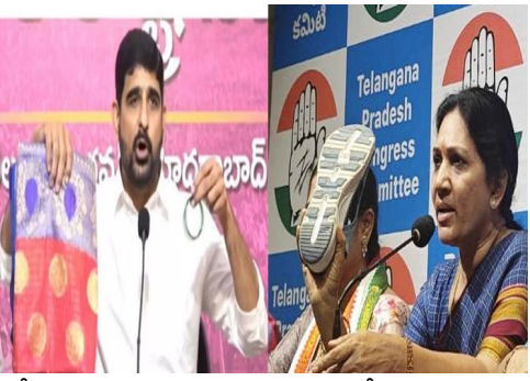
ఉద్దేశించి ఆయన ఘాటు వ్యాఖ్యలు చేశారు.