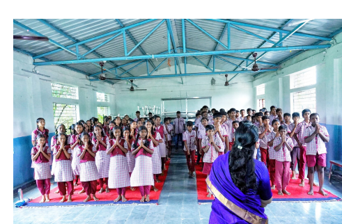
ఉపాధ్యాయులు, విద్యార్థుని విద్యార్థులు తదితరులు పాల్గొన్నారు.