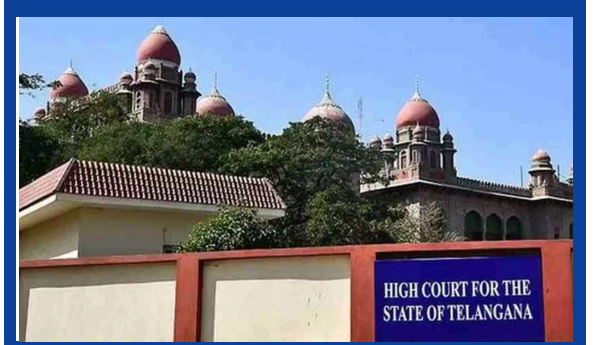
HIGH COURT FOR THE STATE OF TELANGANA

ఆదేశాలిచ్చేదాకా చర్య తీసుకోరా ఎమ్మెల్యే ఫిరాయంపులపై విచారణ పార్టీ ఫిరాయింపులపై హైకోర్టు ప్రశ్న