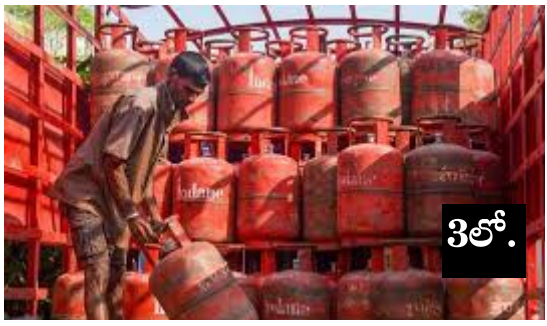
గ్యాస్ సిలిండర్ ధరలు తగ్గవచ్చు జాతీయ మీడియాలో కథలనాలు