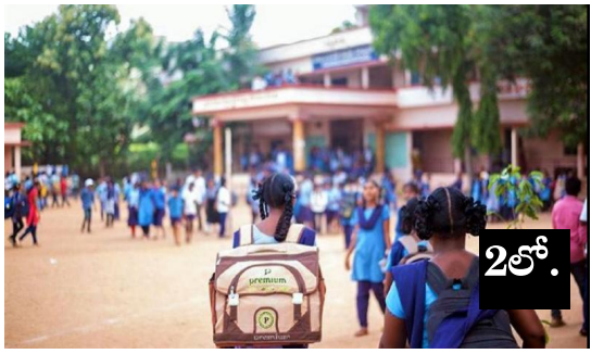
పాఠశాలల వేళలను మారుస్తూ తెలంగాణ విద్యాశాఖ ఉత్తర్వులు