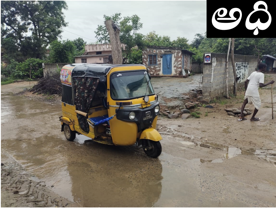
పర్వతగిరి, జూలై 20, (జర్నలిస్ట్ వార్త):

పర్వతగిరి మండలంలోని పలు వైస్ షాపు యజమానుల ఇష్టారాజ్యం సాగుతోంది. శనివారం గ్రామీణ ప్రాంతాల్లోని బెట్ల షాపులకు ఆటో ద్వారా వైస్ యజమానులు పట్టపగలే మద్దం సప్లై చేస్తున్నారు. వైస్ షాపులు మండలంలోని 13 గ్రామాలను పంచుకుని మద్దం సప్లై చేస్తున్నారని స్థానికులు చెబుతున్నారు. మండల పరిధిలోని గ్రామీణ ప్రాంతాల్లో ఒక్కొక్క గ్రామానికి 30 చొప్పున