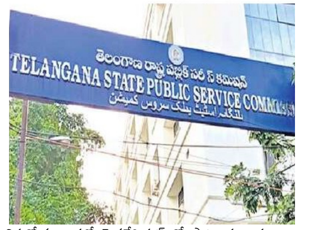
నిరుద్యోగులు ఛలో సెక్రటేరియట్ తో పాటు పలు ధర్నాలు నిర్వహించారు. దీంతో, ప్రభుత్వం పరీక్షలను వాయిదా వేసింది.

హైదరాబాద్, జూలై 19, (జర్నలిస్ట్ వార్త): తెలంగాణలో గ్రూప్-2 పరీక్షలు వాయిదా పడ్డాయి. షెడ్యూల్ ప్రకారం ఈ పరీక్షలు ఆగస్ట్ 7, 8 తేదీల్లో జరగాల్సి ఉంది. డిసెంబర్ నెలకు పరీక్షలను వాయిదా వేస్తున్నట్లు ఈరోజు రాష్ట్ర ప్రభుత్వం ప్రకటించింది. 783 గ్రూప్-2 పోస్టుల భరీకి 2022 డిసెంబర్ లో టీఎస్పీఎస్సీ నోటిఫికేషన్ విడుదల చేసింది. అయితే పలు కారణాల వల్ల పరీక్షల నిర్వహణ వాయిదా పడుతూ వచ్చింది. తాజాగా పరీక్షలను డిసెంబర్ కు వాయిదా వేస్తున్నట్లు ప్రభుత్వం ప్రకటించింది. వాస్తవానికి ఆగస్ట్ 7, 8 తేదీల్లోనే పరీక్షలను నిర్వహిస్తామని ప్రభుత్వం ప్రకటించింది. అయితే పరీక్షలను వాయిదా వేయాలని నిరుద్యోగుల నుంచి పెద్ద ఎత్తున డిమాండ్లు వచ్చాయి. డీఎస్సీ పరీక్షలు జూలై 18 నుంచి ఆగస్ట్ 5 వరకు ఉండటం... ఆ వెంటనే గ్రూప్-2 పరీక్షలు ఉండటంతో నిరుద్యోగుల నుంచి వ్యతిరేకత వచ్చింది.