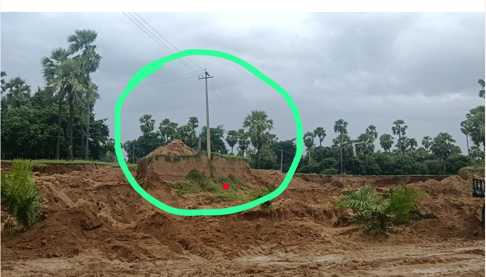
ప్రమాదకరమైన పరిస్థితులు చోటు చేసుకున్నాయని తెలుపుతున్నారు.