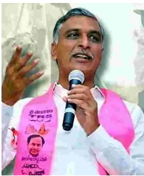
ఓడిపోతే రాజకీయ సన్యాసం చేస్తానని ప్రకటించి, వెన్నుచూపి పారిపోయింది తమరు. రేవంత్ రెడ్డి

హైదరాబాద్: జూలై 18, (జర్నలిస్ట్ వార్త): తెలంగాణలో రుణమాఫీ వ్యవహారంపై ముఖ్యమంత్రి రేవంత్ రెడ్డి.. మాజీ మంత్రి, సిద్దిపేట ఎమ్మెల్యే తన్నీరు హరీష్ రావుల మధ్య గత కొన్ని రోజులుగా సవాళ్ల పర్వం నడుస్తోన్న సంగతి తెలిసిందే. ముందుగా చెప్పినట్లుగానే రేవంత్ రెడ్డి ఆగస్టు కంటే ముందే రుణమాఫీ చేసి చూపించారు. ఈ క్రమంలో హరీష్ రావు రాజీనామా చేయాలని కాంగ్రెస్ నుంచి పెద్దఎత్తున డిమాండ్లు వస్తున్నాయి. మరోవైపు సోషల్ మీడియా వేదికగా కూడా ఈ రాజీనామాపై విమర్శలు వస్తున్న నేపథ్యంలో ఎట్టకేలకు హరీష్ స్పందించారు. రాజీనామాకు సిద్ధమేనని అంటూ మరికొన్ని విషయాలు ప్రస్తావిస్తూ ఓ ప్రకటన విడుదల చేశారు. “సీఎం రేవంత్ రెడ్డి గారూ.. తెలంగాణ ఉద్యమ సమయంలో పదవికి రాజీనామా చేయకుండా వెన్నుచూపి పారిపోయింది తమరు. కొడంగల్లో