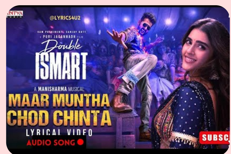
మణిశర్మ అయినా కేసీఆర్ మాటను దర్శకుడు పూరి జగన్నాథ్ నిర్ణయం మేరకే పెట్టారని ఆరోపిస్తున్నారు. పాట రాసిన శ్యామ్, పాడిన సిద్దిగణేష్ ఇద్దరూ తెలంగాణ వారే కావడం గమనార్హం. పాట నుంచి కేసీఆర్ మాటను తొలగించడంతోపాటు పూరి క్షమాపణలు చెప్పాలని డిమాండ్ చేస్తున్నారు.