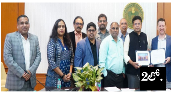
రూ.300 కోట్లతో సిగ్నల్ డెవలప్ మెంట్ కేంద్రాలు