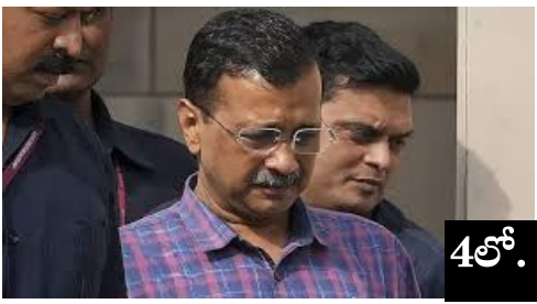
కేజ్రీవాలకు మధ్యంతర బెయిల్ అయినా జైల్లోనే