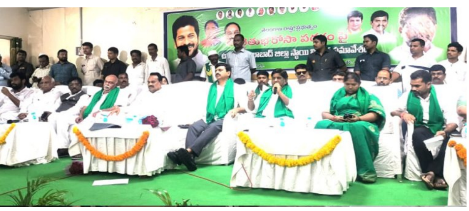
రైతులకు సర్కారు సాయంపై చర్చించి నిర్ణయం తీసుకుంటామని అన్నారు.

ఆదిలాబాద్ జూలై 11,(జర్నలిస్ట్ వార్త): క్షేత్రస్థాయిలో రైతుల నుండి అభిప్రాయాలు సేకరించి పూర్తిస్థాయి మార్గదర్శకాలతో 'రైతుభరోసా' పథకాన్ని పక్కపక్కగా అమలు చేస్తామని రాష్ట్ర ఉప ముఖ్యమంత్రి మల్లు భట్టి విక్రమార్కు స్పష్టం చేశారు. గురువారం ఆదిలాబాద్ జిల్లా ఉటూర్ ఏజెన్సీ కేంద్రంలోని కేబీ కాంప్లెక్స్ సమావేశ మందిరంలో రైతు భరోసా విధివిధానాల ఖరారుపై ఉమ్మడి ఆదిలాబాద్ జిల్లా రైతుల నుండి అభిప్రాయాలు, సలహాలను క్యాబినెట్ సబ్ కమిటీ సేకరించింది. క్యాబినెట్ సబ్ కమిటీ చైర్మన్, ఉపముఖ్యమంత్రి బట్టి విక్రమార్కు తో పాటు మంత్రులు తుమ్మల నాగేశ్వరరావు, పొంగులేటి శ్రీనివాస్ రెడ్డి, జిల్లా ఇన్చార్జ్ మంత్రి దినసరి సీతక్క శాసనసభ్యులు ఎమ్మెల్సీలు పాల్గొన్నారు.