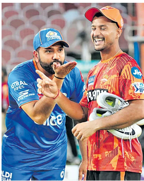
ఇప్పుడీ రెండు జట్లు తొలి గెలుపుపై గురిపెట్టాయి. ఈ సీజన్ లో సొంతగడ్డపై సన్ రైజర్స్ కు ఇదే మొదటి

మార్చి 26(జుబ్బిల్స్ వార్త) హైదరాబాద్: హైదరాబాద్: కొత్త సారథులు.. సరికొత్త ఉత్సాహంతో బరిలో దిగిన సన్ రైజర్స్ హైదరాబాద్, ముంబయి ఇండియన్స్ జట్లకు ఆరంభ మ్యాచ్ లో పరాజయాలు తప్పలేదు. ఆ మ్యాచ్ లో రెండు జట్లూ విజయానికి దగ్గరగా వచ్చినా ఆఖర్లో తడబాటుతో బోణీ కొట్టలేకపోయాయి. మరి బుధవారం ఉప్పల్ స్టేడియంలో అమీతుమీ తేల్చుకోనున్న సన్ రైజర్స్, ముంబయిలో మురిసేదెవరు? గెలుపు బోణీతో పాయింట్ల ఖాతా తెరిచేదెవరు? కోల్కతా నైట్ రైజర్స్ తో జరిగిన తొలి మ్యాచ్ లో సన్ రైజర్స్ గెలుపు ముంగిట బోలెడంది. హెన్రీక్ క్లూసెన్, షాబాజ్ అహ్మద్ జట్టును విజయానికి చేరువ చేసినా.. హార్షిత్ రాణా అద్భుతమైన బౌలింగ్ తో కమిన్స్ సేన ఆశలపై నీళ్లు చల్లాడు. గుజరాత్ టైటాన్స్ తో మ్యాచ్ లో ముంబయి అదే పరిస్థితి. చివరి ఓవర్ వరకు రేసులో ఉన్న ముంబయి ఆఖరి నాలుగు బంతుల్లో తడబడి మ్యాచ్ ను చేజారుకుంది.