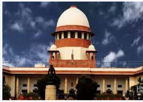
కమిషనర్ యాక్ట్ కు 2023లో కేంద్రం సవరణ చేసింది. ఈ చట్ట సవరణను సవాల్ చేస్తూ సుప్రీంకోర్టులో పిటిషన్లు దాఖలయ్యాయి. వీటిపై విచారణ చేపట్టిన సుప్రీంకోర్టు ప్రైవేట్గా పేర్కొంది.

ఇవ్వడానికి నిరాకరించింది. ఈ దశలో ఎన్నికల కమిషనర్ల నియామకంపై స్టే విధించలేమని స్పష్టం చేసింది. ఎన్నికల కమిషనర్ల నియామక చట్టంలో తాము జోక్యం చేసుకోలేమని అత్యున్నత న్యాయస్థానం తేల్చి చెప్పింది. సీఈసీ, ఈసీల ఎంపిక ప్యానెల్ నుంచి సుప్రీంకోర్టు ప్రధాన న్యాయమూర్తిని తప్పిస్తూ చీఫ్ ఎలక్షన్