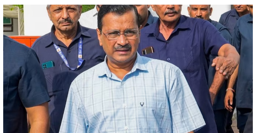
కేజ్రీవాల్ నివాసంలోనే రెండు గంటల పాటు విచారించిన ఈడీ అధికారులు ఆ తర్వాత అరెస్ట్ చేసినట్లు ప్రకటన