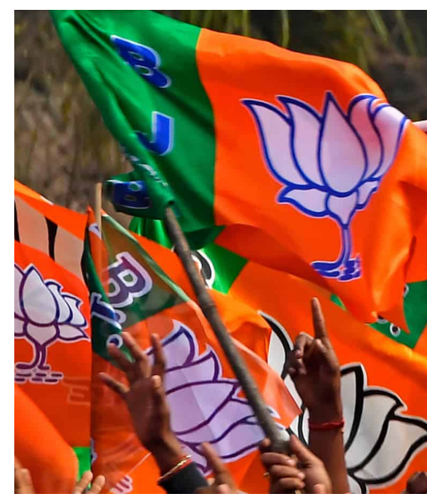
ఇండియా కూటమిలోని ఇతర మిత్రపక్షాలు 56 సీట్లు గెలుచుకోవచ్చునని తెలిపింది.

(జర్నలిస్ట్ వార్త): రాజీయే పార్లమెంట్ ఎన్నికల్లో ఎన్టీయే కూటమి 400కు పైగా లోక్ సభ సీట్లను గెలిచి అద్భుత విజయం సాధించే అవకాశం ఉందని న్యూస్ 18 మెగా ఒపీనియన్ పోల్ సర్వే తెలిపింది. 543 సీట్లకు గాను బీజేపీ నేతృత్వంలోని ఎన్టీయే కూటమి 411 సీట్లు గెలుచుకోవచ్చునని, కాంగ్రెస్ ఆధ్వర్యంలోని ఇండియా కూటమి 105 సీట్లు గెలుచుకోవచ్చునని, ఇతరులు 27 సీట్లు గెలుచుకోవచ్చునని సర్వే విశ్లేషించింది. స్వతంత్ర భారతదేశంలో కాంగ్రెస్ పార్టీకి 1985లో 426 సీట్లు వచ్చాయి. ఆ తర్వాత ఇప్పుడు ఎన్టీయే 400 మార్కును దాటవచ్చునని ఈ సర్వే వెల్లడించింది. బీజేపీ సొంతగా 350 సీట్లు గెలుచుకోవచ్చునని.. మిత్రపక్షాలతో కలిసి 61 గెలుచుకోవచ్చునని తెలిపింది. కాంగ్రెస్ కేవలం 49 సీట్లకే పరిమితం కానుందని ఈ సర్వే వెల్లడించింది.