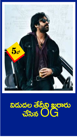
విడుదల తేదీని బారారు చేసిన OG