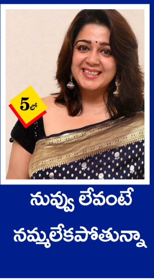
5... నువ్వు లేవంటే నమ్మలేకపోతున్నా