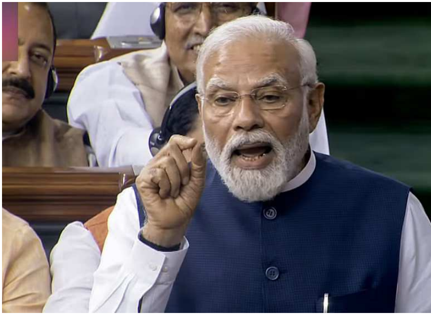
డిమాండ్ చేస్తున్నారు. విద్యుత్ సవరణ బిల్లు 2020ని రద్దు చేయాలని రైతులు కోరారు మరియు 2013 భూసేకరణ చట్టాన్ని తిరిగి ప్రవేశపెట్టాలని కోరుతున్నారు. మహాత్మా గాంధీ జాతీయ గ్రామీణ ఉపాధి హామీ చట్టం,