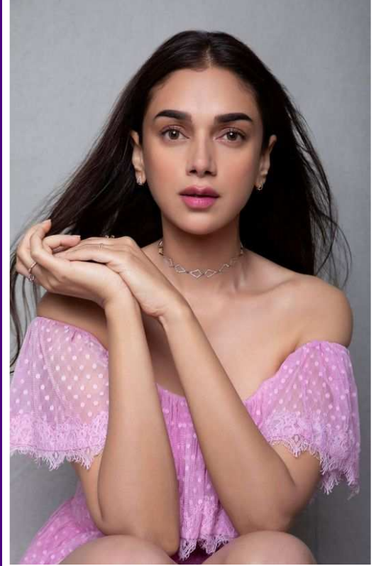
మోడ్రన్ డ్రస్సుల్లోనూ అదర్గోడుతుంది ఈ అమ్మడు. తాజాగా కొన్ని ఫోటోలను సీర్ చేసింది అదితి రావు హైదర్. చీరకట్టులో ఈ అమ్మడి అందం మరింత ఎక్కువైంది అంటున్నారు ఫ్యాన్స్. ఈ ఫోటోలకు క్రేజ్ కామెంట్స్ వస్తున్నాయి.

అదితి రావు హైదర్.. చెలియా తో హీరోయిన్ గా టాలీవుడ్ ప్రేక్షకులకు పరిచయం అయ్యింది ఈ అందాల భామ. ఆతర్వాత సమ్మోహనం తో సూపర్ హిట్ అందుకుంది. ఆతర్వాత పరుసగా లు చేసింది ఈ చిన్నది. అదితి రావు హైదర్.. చెలియా తో హీరోయిన్ గా టాలీవుడ్ ప్రేక్షకులకు పరిచయం అయ్యింది ఈ అందాల భామ. చూడ వచ్చు రూపంతో ఆకట్టుకుంది ఈ ముద్దుగుమ్మ. తమిళ లో పలు లో నటించినప్పటికీ చెలియా తో మంచి క్రేజ్ సొంతం చేసుకుంది అదితి రావు హైదర్. ఆతర్వాత ఇంద్రగంధి మోహన్ కృష్ణ దర్శకత్వం వహించిన సమ్మోహనం తో తెలుగులో సూపర్ హిట్ అందుకుంది. ఈ లో సుధీర్ బాబు హీరోగా నటించాడు. మొదటి అయినా తెలుగులో చక్కగా మాట్లాడి ప్రేక్షకులను ఆకట్టుకుంది అదితి. ఆతర్వాత పరుసగా లు చేసింది ఈ చిన్నది. సమ్మోహనం సూపర్ హిట్ అవుడంతో ఈ చిన్నదానికి ఆఫర్స్ క్యూ కట్టాయి. పరుసగా వరుణ తేజ్ తో అంతరిక్షం, నాని, సుధీర్ బాబు మల్లీస్వారం వి. శర్వానంద్, సిద్ధార్థ్ మల్లీస్వారం మహానమ్మద్రంలాంటి లు చేసింది కాలి మంచి హిట్ మాత్రం అందుకోలేకపోయింది అదితి రావు హైదర్. తమిళ లోనూ ఇప్పుడు ఈ చిన్నది పెద్దగా కనిపించడం లేదు. అక్కడ హీ సినామిక అనే లో నడిచింది. ఈ లో దుల్కర్ సల్మాన్ హీరోగా నటించాడు. అలాగే కాజల్ అగర్వాల్ మరో హీరోయిన్ గా నటించింది. ఇక సోషల్ మీడియాలో మాత్రం రెగ్యులర్ గా అభిమానులతో టచ్ లో ఉంటుంది. సోషల్ మీడియాలో అదితి సీర్ చేసే ఫోటోలకు మంచి క్రేజ్ ఉంది. చీరకట్టుతో పాటు