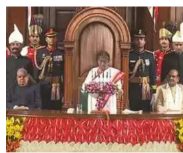
చెప్పారు. భారత సంస్కృతి సభ్యత ఎంతో చైతన్యవంతమైనదని గుర్తు చేశారు. పార్లమెంటు సమావేశాల

న్యూఢిల్లీ, జనవరి 31 జర్నలిస్ట్ వార్త వికసిత భారతావనిని నిర్మించే పనిలో గడిచిన పదేళ్లలో ఎన్నో మైలు రాళ్లు చేరుకున్నామని రాష్ట్రపతి ద్రౌపది ముర్ము పేర్కొన్నారు. ఆత్మనిర్భర్ భారత్, మేకిన్ ఇండియా మన బలాలుగా మారాయని అన్నారు. తమ ప్రభుత్వం సంక్షేమాన్ని, అభివృద్ధిని సమపాక్షంలో చూస్తుందని.. దేశాభివృద్ధి కోసం కట్టుబడి ఉందని అమె అన్నారు. సూతన పార్లమెంటు భవనంలో తనది తొలి ప్రసంగమని