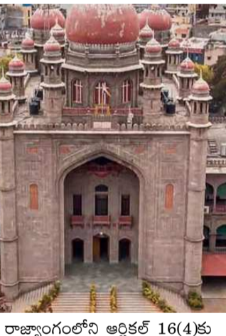
రాజ్యాంగంలోని ఆర్టికల్ 16(4)కు లోబడి క్లాసిఫికేషన్ చేయాలిగానీ.. ఇష్టం వచ్చినట్లు నిర్ణయం తీసుకోవడం చెల్లదు. ఆంధ్రప్రదేశ్ లో డీఎస్సీ-2008 బీఎడ్ అభ్యర్థుల విషయంలో ఆ ప్రభుత్వం మంచి నిర్ణయం తీసుకుంది.

తెలంగాణలో ఎలాంటి నిర్ణయం తీసుకోకపోవడం సరికాదని న్యాయస్థానం చెప్పింది. 2008- డీఎస్సీ నోటిఫికేషన్ లో తమ కంటే తక్కువ అర్హత ఉన్న డీఎస్సీ అభ్యర్థులకు 30 శాతం ఎస్ జీ టీ పోస్టులను రిజర్వ్ చేయడాన్ని వ్యతిరేకిస్తూ బీఎడ్ అభ్యర్థులు హైకోర్టును ఆశ్రయించారు. ఈ విజయవంత జస్టిస్ అభినంద్ కుమార్ షాని బి, జస్టిస్ నామవరపు రాజేశ్వర్ రావు ధర్మాసనం గురువారం మరోసారి విచారణ చేపట్టింది. ఒకే రకమైన పోస్టులకు అర్హత ఎక్కువైన వారిని కాదని.. తక్కువ ఉన్న వారిని నియమించడం చట్టప్రకారం సరికాదని విజిషన్ తరపు న్యాయవాదులు వాదించారు. 'ప్రభుత్వ ఉద్యోగాల్లో నియామకాలు చేసేటప్పుడు