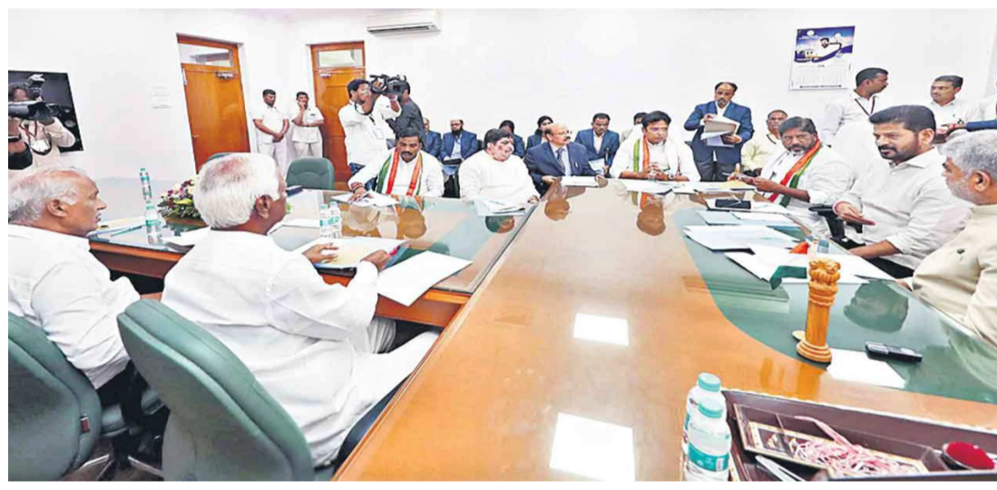
కేసీఆర్ కు బదులు తాను పాల్గొనడంపై సమాచారం ఇచ్చామన్న మాజీ మంత్రి

హైదరాబాద్: జర్నలిస్ట్ వార్త శాసనసభ నిర్వహణ తేదీలు, ఎజెండా ఖరారు కోసం స్పీకర్ గద్దం ప్రసాద్ కుమార్ అధ్యక్షతన జరిగిన బిజినెస్ అడ్రెస్ జంటి (బీఏసీ) సమావేశంలో మంత్రులు, మాజీ మంత్రి హారీశ్ రావు మధ్య స్వల్ప వాగ్వివాదం జరిగింది. బీఆర్ఎస్ శాసనసభా పక్ష నేత కేసీఆర్ కు బదులు హారీశ్ రావు బీఏసీ భేటీకి హాజరు కావడంపై మంత్రులు శ్రీధర్ బాబు, పొన్నం ప్రభాకర్ అభ్యంతరం వ్యక్తం చేశారు. గురువారం ఉభయ సభలను ఉద్దేశించి గవర్నర్ ప్రసంగం అనంతరం స్పీకర్ చాంబర్లో బీఏసీ తొలి సమావేశం ప్రారంభమైంది. స్పీకర్ కు సమాచారం ఇచ్చినట్లు బీఆర్ఎస్ వర్గాలు వెల్లడించాయి. అయితే శ్రీధర్ బాబు, పొన్నం అభ్యంతరం వ్యక్తం చేయడంతో వాగ్వివాదం జరిగింది. కేసీఆర్ కు బదులుగా తాను హాజరయ్యేందుకు స్పీకర్ అంగీకరించారని హారీశ్ చెప్పారు. అయితే ఈ అంశంపై తాము ఇంకా ఎలాంటి నిర్ణయం తీసుకోలేదని, కాబట్టి హారీశ్ రావు హాజరయ్యేందుకు వీలు లేదని శ్రీధర్ బాబు పేర్కొన్నారు. అలా హాజరయ్యేందుకు వీలు లేదు: శ్రీధర్ బాబు తాము ఎవరిని బీఏసీ సమావేశం నుంచి బయటకు వెళ్లమని చెప్పలేదని శాసన సభా వ్యవహారాల శాఖ మంత్రి డి.శ్రీధర్ బాబు స్పష్టం చేశారు. గురువారం అసెంబ్లీ లాబీలో ఆయన మీడియాతో మాట్లాడారు. స్పీకర్ నిర్ణయం మేరకు బీఏసీ సమావేశంలో పాల్గొనేందుకు బీఆర్ఎస్ నుంచి ఇద్దరు సభ్యులకు అవకాశం కల్పించారని చెప్పారు. దీంతో బీఆర్ఎస్ తరపున మాజీ సీఎం కేసీఆర్, మాజీ మంత్రి కడియం శ్రీహరి పేర్లు ఇచ్చారని తెలిపారు. అధికార పార్టీ తరపున శ్రీధర్ బాబు, పొన్నంతో పాటు సీఎం రేవంత్ రెడ్డి, డిప్యూటీ సీఎం భట్టి విక్రమార్యు ప్రతిపక్ష బీఆర్ఎస్ తరపున హారీశ్ రావు, కడియం శ్రీహరి హాజరయ్యారు. తాను అనారోగ్యంతో బాధపడుతున్నందున తనకు బదులుగా హారీశ్ రావు బీఏసీ సమావేశంలో పాల్గొంటారంటూ మాజీ సీఎం కేసీఆర్ బుధవారం