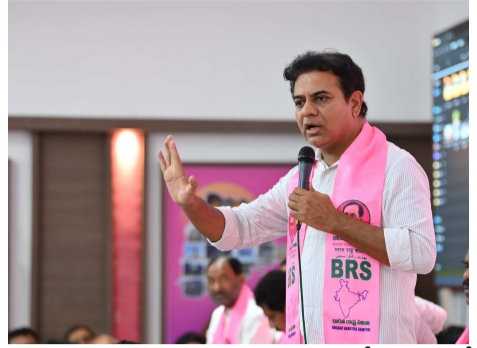
పడిందన్నారు. రేవంత్ భుజం మీద తుపాకీ పెట్టి మోడీ బీఆర్ఎస్ను కాలుస్తారట అంటూ వ్యాఖ్యలు చేశారు. మైసూర్లో సోదరులకు కాంగ్రెస్ - బీజేపీ అక్రమ సంబంధం గురించి చెప్పాలన్నారు. అదానీని రాహుల్ దొంగ అన్నారు.. రేవంత్ దొర అంటున్నారని కేటీఆర్ వ్యాఖ్యలు చేశారు. కార్యక్రమం పార్టీకి కథనాయకులు అని బీఆర్ఎస్ వర్గం ప్రెసిడెంట్ కేటీఆర్ స్పష్టం చేశారు. తెలంగాణ భవన్ లో నల్లగొండ నియోజకవర్గంపై సమాజ్ సమావేశం నిర్వహించారు. కార్యక్రమం వల్ల ఇన్స్ట్రక్షన్లు పార్టీ బలంగా ఉండవచ్చు. చివరిగా నల్లగొండ రివ్యూ చేస్తున్నామని గత 16 సమావేశాలు తీరు చూస్తే కార్యక్రమం పార్టీకి దైర్యం చెప్పారని గుర్తు చేసుకున్నారు. నల్లగొండ లో ఎన్నికల ప్రచారం సరళి మనకు అనుకూలంగా ఉన్నట్లే

సోమవారం తెలంగాణ భవన్లో సర్టిఫైడ్ లోక్సభ నియోజకవర్గ సన్మానక సమావేశం లో కేటీఆర్ మాట్లాడుతూ.. ఫిబ్రవరి మొదటి వారం నుంచి అసెంబ్లీ నియోజకవర్గాల సమాజ్ కలెక్షన్లు మొదలవుతాయి. తాము ఇంకా మాట్లాడటం మొదలు పెట్టలేదు.. కాంగ్రెస్ వాళ్ళు ఉలికిపడుతున్నారున్నారు. కేటీఆర్ అసెంబ్లీకి వస్తే ఇంకెలా ఉంటుందో ఉపాధి కేంద్రాల వాళ్ళు. హామీలకు కాంగ్రెస్ పంగనామాలు పెట్టే ప్రయత్నం చేస్తోంది.. అయినా పదిలి పెట్టింది లేదని స్పష్టం చేశారు. ఎన్నికల్లో గెలిచేందుకు రేవంత్ రెడ్డి అడ్డమైన మాటలు చెప్పారని మండిపడ్డారు. కార్యక్రమం ఉదాసీన వైఖరి మీమాంసన వీధుల నుంచి కాంగ్రెస్ నేతలు ఏం మాట్లాడారు.. ఇప్పుడేం చేస్తున్నారో ప్రజలకు విడమరచి చెప్పాలని సూచించారు. కోమటి రెడ్డి గత నవంబర్లోనే కరెంటు బిల్లులు కట్టవద్దని చెప్పారన్నారు. నల్లగొండ ప్రజలు బిల్లులు కట్టకుండా కోమటి రెడ్డికి పంపించా లన్నారు. సాగర్ ఆయకట్టుకు కాంగ్రెస్ పాలనలో మొదటి సారి క్రాఫ్ హాబీదే ప్రకటించే దుస్థితి దాపురించిందన్నారు. కృష్ణా రివర్ డివలప్మెంట్ ప్రాజెక్టును అప్పగించి తెలంగాణ జుట్టును కాంగ్రెస్ కేంద్రం చేతిలో పెడుతోందని ఆగ్రహం వ్యక్తం చేశారు. శ్రీరాం సాగర్ చివర ఆయకట్టును కాంగ్రెస్ ప్రభుత్వం ఎండబెడుతోందన్నారు. కాంగ్రెస్, బీజేపీ అక్రమ బంధం నల్లగొండ మున్సిపాలిటీ అవిశ్వాసంలో బయట