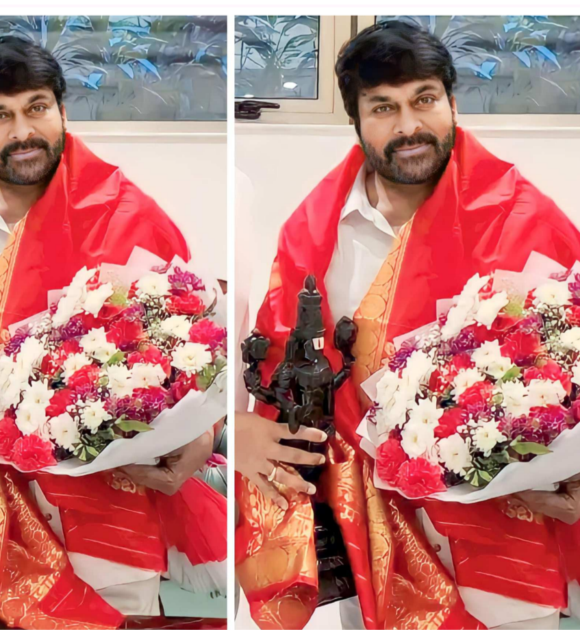
చేశారు. కొన్ని రోజులు అంబలెన్స్ సర్వీసులు సడీపారు. ఈ సేవలను గుర్తించిన కేంద్ర ప్రభుత్వం చిరంజీవికి పద్మ విభూషణ్ పురస్కారంతో సత్కరిస్తున్నట్లు తెలిసింది. సోషల్ మీడియాలో ప్రచారం మెగా అభిమానులకు అమోఘానందం కలిగిస్తోంది. సందమూరి తారక రామారావు, అక్కినేని నాగేశ్వరరావు, కృష్ణ తరాసికి చెందిన హీరోలు రెండు, మూడు వందల సినీమాల చేశారు. అయితే... ప్రస్తుతం, ఈ తరంలో తెలుగులో అత్యధిక సినీమాల చేసిన అగ్ర హీరో చిరంజీవి అని చెప్పాలి.

సోషల్ మీడియాలో చార్జ్ తో అభిమానుల్లో ఆనందం