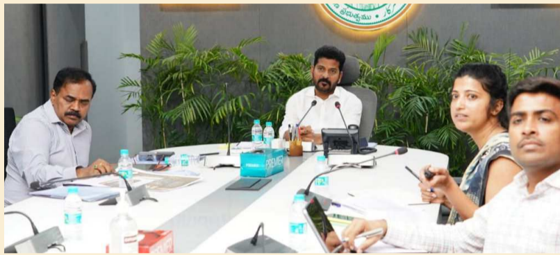
హైదరాబాద్, జనవరి 2 జర్నలిస్ట్ వార్త మెట్రో రైల్వేపై తెలంగాణ సిఎం రేవంత్ రెడ్డి సమీక్ష నిర్వహించారు. మెట్రో లైన్ పొడిగింపు, ప్రస్తుత పలు అంశాలను దృష్టిలో ఉంచుకుని వాటిని సవరిస్తున్నట్లు తెలిపారు.

పరిస్థితిపై అధికారులతో సీఎం చర్చించారు. శంషాబాద్ ఎయిర్పోర్టుకు మెట్రో మార్గం ప్రణాళికలపై అధికారులు ముఖ్యమంత్రికి వవర్ పాయింట్ ప్రజెంటేషన్ ఇచ్చారు. ఎయిర్పోర్టుకు మెట్రోను రద్దు చేయటం లేదని ఇప్పటికే స్పష్టత ఇచ్చిన సీఎం రేవంత్ రెడ్డి..