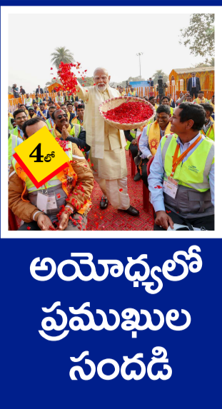
అయోధ్యలో ప్రముఖుల సందడి