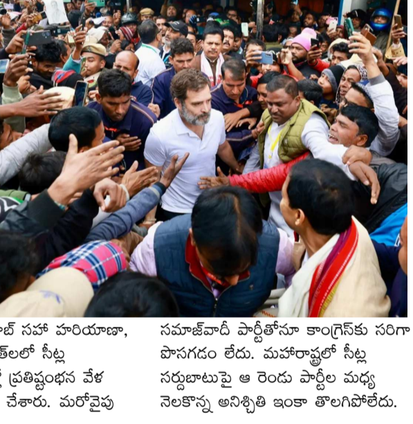
వెల్లడించారు. పంజాబ్ సహా హరియాణా, సమాజ్ వాదీ పార్టీతోనూ కాంగ్రెస్ కు సరిగా పొసగడం లేదు. మహారాష్ట్రలో సీట్ల సర్దుబాటుపై ఆ రెండు పార్టీల మధ్య నెలకొన్న అనిశ్చితి ఇంకా తొలగిపోలేదు.

చేశానని, కాంగ్రెస్ దానిని తోసిపుచ్చిందని, దీంతో సొంతంగానే పోటీకి దిగాలని నిర్ణయించుకున్నామని మమత మీడియాకు వెల్లడించారు. సీట్లపై రెండు పార్టీల మధ్య చర్చలు జరుగుతున్నాయన్న వార్తల్ని తోసిపుచ్చారు. ఈ అంశంపై కాంగ్రెస్ లో ఏ ఒక్కరితోనూ తాను మాట్లాడలేదని ఎల్ఎంసీ నంబందం ఉండబోదన్నారు. జాతీయస్థాయిలో సంబంధాల పైనా పునరాలోచిస్తానని తెలిపారు. విపక్షాలను ఏకతాటిపైకి తీసుకొచ్చి భాజపాను ఎదుర్కోవాలని ప్రయత్నిస్తున్న కాంగ్రెస్ ను దీర్ఘ వ్యాఖ్యలు తీవ్ర ఒత్తిడిలోకి నెట్టేశాయి. ఆమ్ ఆర్జీ కూడా సంజాబ్ లో మొత్తం 13 లోకసభ స్థానాల్లో ఐదోకి దిగుతుందని ఆ రాష్ట్ర ముఖ్యమంత్రి భగవంత్ మన్