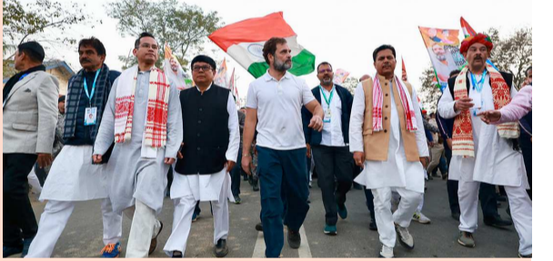
(మొదటి పేజీ తరువాయి)

బారికేడ్లను బద్దలు కొట్టేలా అక్కడి సమాహాన్ని ప్రేరేపించారని ఆరోపించారు. ఈ క్రమంలో అక్కడ దుర్ఘాటాలో ఉన్న పోలీసు అధికారిపై కూడా దాడి చేసినట్లు తెలిపారు. కాగా, 'భారత్ జోడో' న్యాయ యాత్రపై కేసు నమోదు చేయడాన్ని కాంగ్రెస్ తీవ్రంగా ఖండించింది. యాత్రకు అడ్డంకులు సృష్టించేందుకు ప్రయత్నిస్తున్నారని, అందుకే ఎఫ్బిఆర్ నమోదు చేశారని కాంగ్రెస్ కు చెందిన అస్సా ప్రతిపక్ష నేత దేబాబ్రత సైకియా మండిపడ్డారు. ట్రాఫిక్ మళ్లింపు దగ్గర పోలీసులెవరూ లేరని చెప్పారు. యాత్ర కోసం తమకు కేటాయించిన మార్గం చాలా ఇరుకుగా ఉందని, జనాలు పెద్ద సంఖ్యలో హాజరవుతుంటే కొన్ని మీటర్ల పాటు పక్కమన్న దారి గుండా ప్రయాణించాల్సి వచ్చిందని వివరించారు. రాహుల్ న్యాయ యాత్ర విజయవంతం అవుతుందన్న భయంతోనే.. సీఎం హిమంత్ శర్మ తమ యాత్రకు ఆటంకం కలిగించాలను కుంటున్నారని ఆరోపించారు.