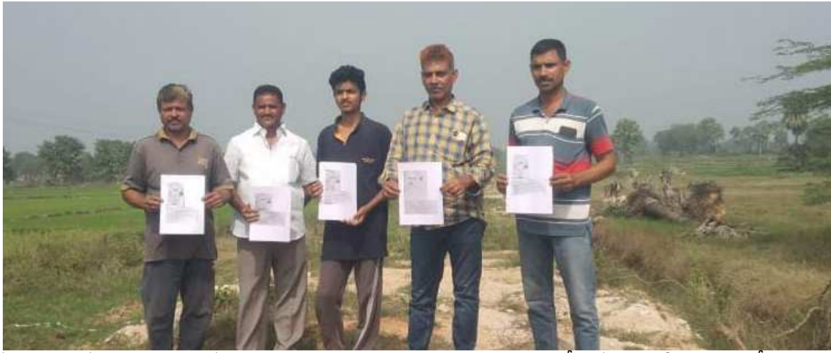
కుమ్మకై తమకు రైతు బంధు రాకుండా అడ్డు పడుతున్నారని అధికారులు చర్యలు తీసుకుని వారికి న్యాయం చేయాలని వాపోయారు. తమ భూమిలో ఎలాంటి సమాచారం ఇవ్వకుండా రోడ్డు నిర్మాణం చేసిన సదరు కాంట్రాక్టర్ పై