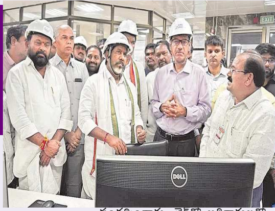
మణుగూరు జర్నలిస్ట్ వార్త విద్యుత్ సెక్టార్ను గత బీఆర్ఎస్

ప్రభుత్వం అప్పుల ఊబిలోకి నెట్టివేసిందిని ఉప ముఖ్యమంత్రి, విద్యుత్, ఆర్థిక శాఖ మంత్రి మల్లు భట్టి విక్రమార్క విమర్శించారు. విద్యుత్ కొనుగోలుకు రూ. 30,406 కోట్లు, బకాయిల పేరుతో రూ. 59,580 కోట్లు అప్పు చేసి లెక్కలు లేకుండా తారుమారు చేసిన ఘనత మాజీ సీఎం కేసీఆర్ కే దక్కుతుందని ఆయన ధ్వజమెత్తారు. భద్రాద్రి కొత్తగూడెం జిల్లా మణుగూరులోని భద్రాద్రి ధర్మలక్ష్మి పవర్ స్టేషన్ ను శనివారం భట్టి