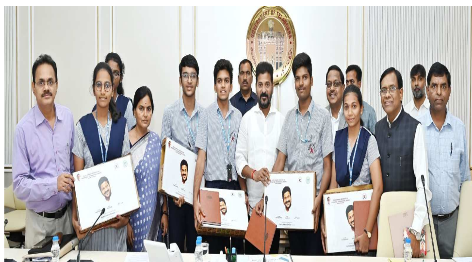
హైదరాబాద్, డిసెంబర్ 30 జర్నలిస్ట్ వార్త తెలంగాణలోని పంచాయతీల్లో బడి ఉండాలని ముఖ్యమంత్రి ఎన్మమల రేవంత్ రెడ్డి స్పష్టం చేశారు.

బడిలని గ్రామం ఉండరాదని అన్నారు. రాష్ట్రంలో ఎంత చిన్న గ్రామమైన, మారుమూల తాండా అయినా తప్పకుండా ఒక ప్రభుత్వ పాఠశాల ఉండాలి. ఏ ఒక్క బాలబాలికలు చదువు కోసం ఇతర గ్రామాలకు,